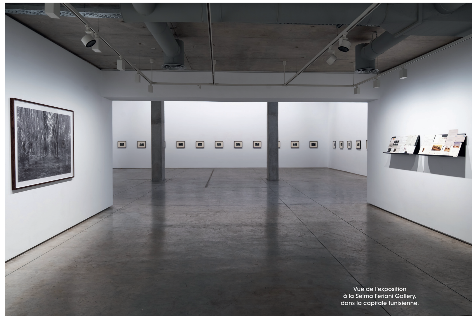
Vue de l'exposition à la Selma Feriani Gallery, dans la capitale tunisienne.