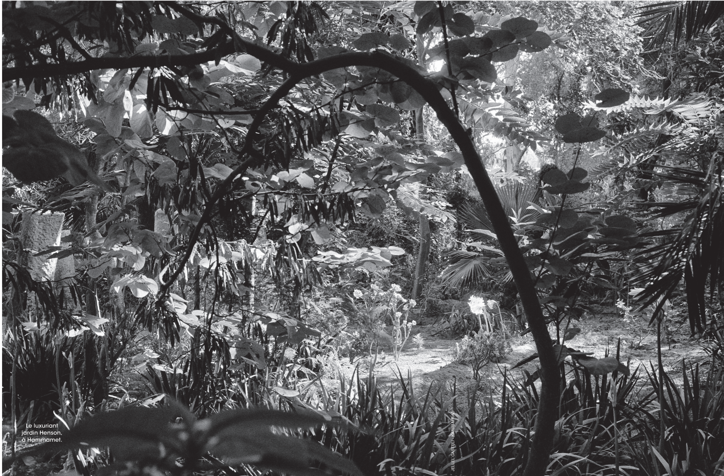
Le luxuriant jardin Henson, à Hammamet.