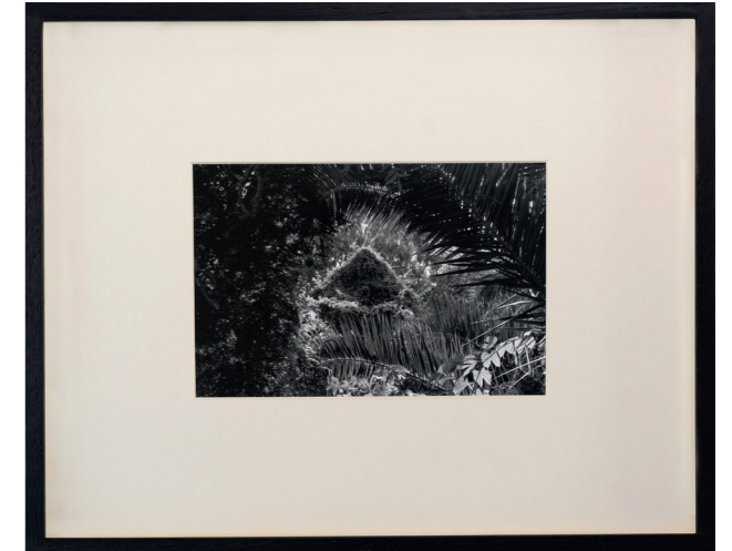
De haut en bas et de gauche à droite: Hortus VII, Hortus XXII, Hortus I, Hortus XIV, toutes capturées autour de l'année 1980.