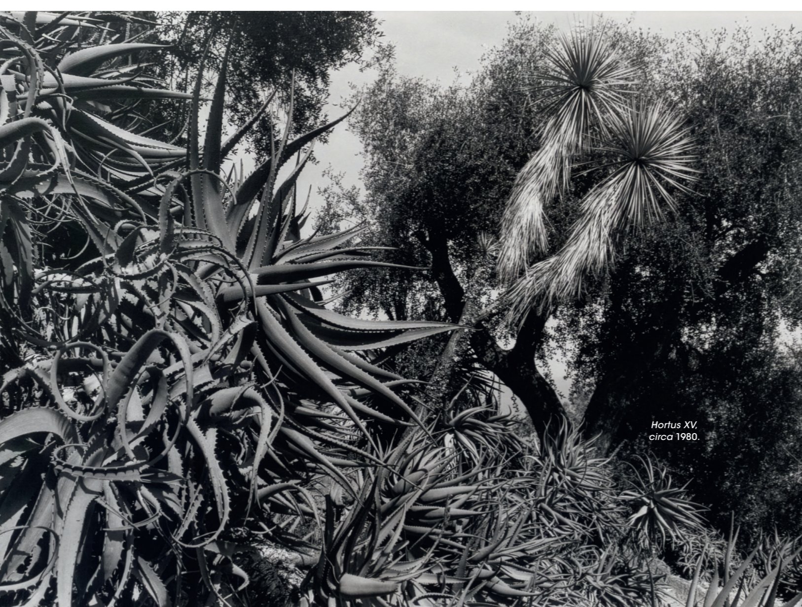
Hortus XV, circa 1980.

” Je ne compte plus les heures dans ma chambre noire, à chercher l'exacte nuance de gris qui traduirait le mieux la matière épaisse d'une feuille d'agave.