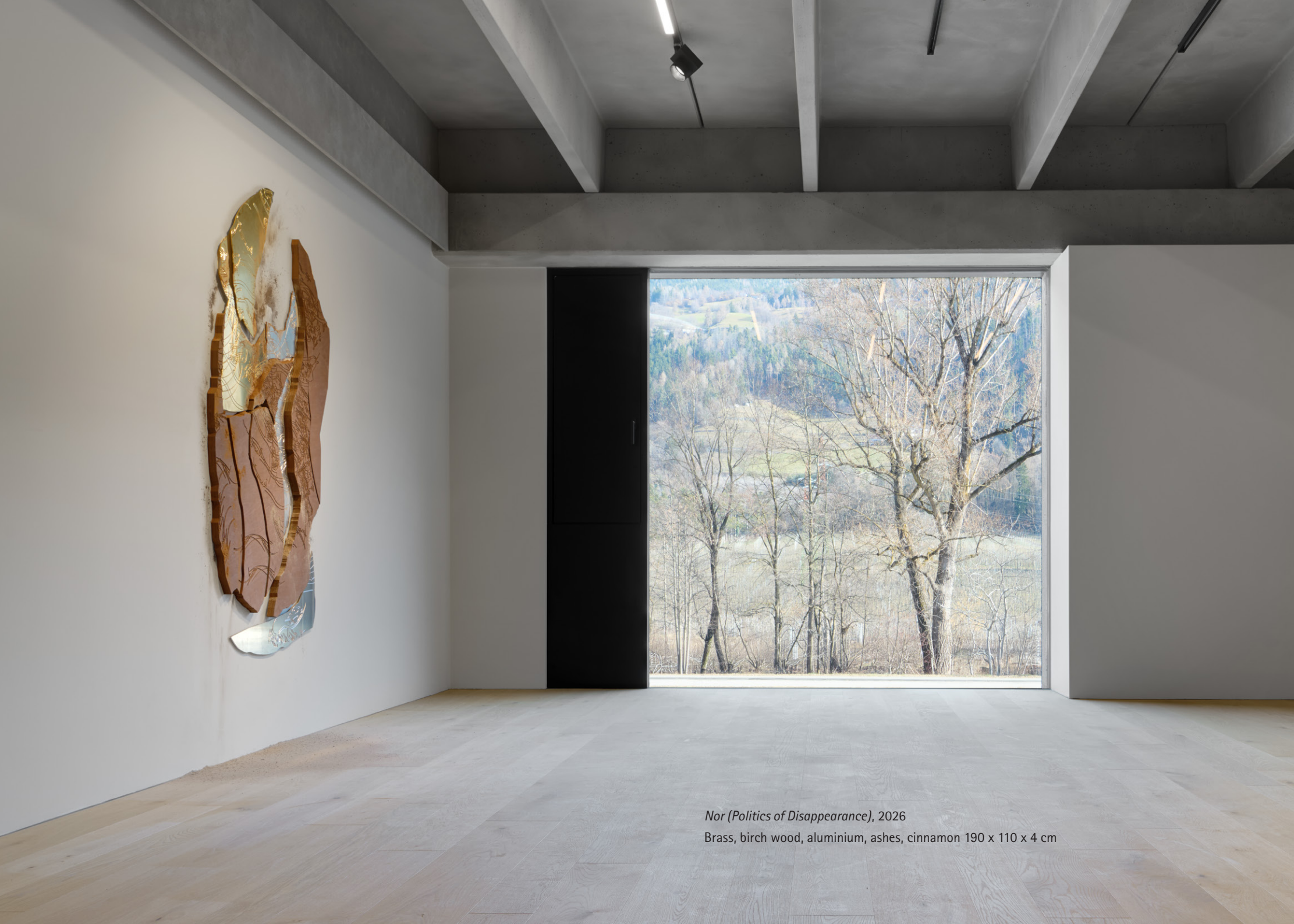
Nor (Politics of Disappearance), 2026

Brass, birch wood, aluminium, ashes, cinnamon 190 x 110 x 4 cm